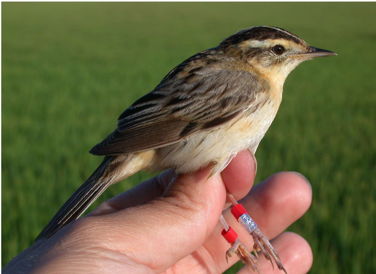
Figura 2. Carricerín cejudo Acrocephalus paludicola adulto marcado con una combinación única de anillas, colores y anilla metálica, en el Brazo de la Torre, marismas de Doñana (Sevilla).

En total se obtuvieron 80 aves registradas entre 1919 y 2019 (Tabla II). La primera cita histórica que se tiene constancia fue en 1919 cuando se observa un ave el 22 de octubre de 1919, sin especificar paraje en alguna zona de la bahía de Algeciras (Stenhouse 1921). Posteriormente, existe una cita de un ave en agosto de 1968 en Doñana, en el arroyo de La Rocina (Llandres y Urdiales 1990); tres aves en agosto de 1970 en el Caño de Guadiamar, también en las marismas de Doñana (Fernández-Cruz 1972, García et al. 2000); y otro ejemplar a finales de los años 60, en la laguna Grande de Baeza en Jaén, sin especificar fecha (Fernández-Cruz 1972). En años 90 se registran más aves en el litoral de la provincia de Málaga y en menor medida citas aisladas en el litoral de Almería y de Cádiz.