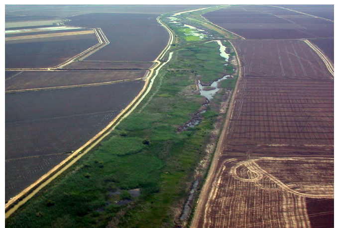
Figura 1. Vista aérea del Brazo de la Torre, marismas de Doñana (Sevilla).

Por otro lado, se estudian los parámetros de estado corporal y sedimentación en el Brazo de la Torre, Espacio Natural Doñana, durante el paso postnupcial (finales de julio a finales de septiembre) del periodo 2000-2009 (Tabla I). Para las capturas se utilizaron redes japonesas, entre 60 y 240 metros lineales, y se analizaron un total de 161 jornadas de anillamiento, con un esfuerzo de muestreo homogéneo y una frecuencia similar cada temporada. Se trata del cauce de un brazo del río Guadalquivir utilizado para evacuar los excedentes de agua de riego de los cultivos de arroz circundantes. Posee entre 75 y 150 m de ancho y 60 km de longitud y está cubierto por vegetación palustre dominada por carrizo Phragmites australis (Fig. 1). Como sugiere Julliard et al. (2006) se usó el canto del carricerín cejudo como reclamo para atraer a los individuos a las redes. Para más detalles de la metodología de captura ver Arroyo (2005).