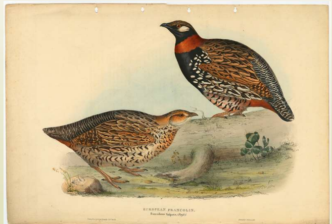
Fig. 1. Un grabado de una pareja, hembra y macho, de francolín ventrinegro, Francolinus francolinus , de la obra Birds of Europe (1832-1837) de John Gould