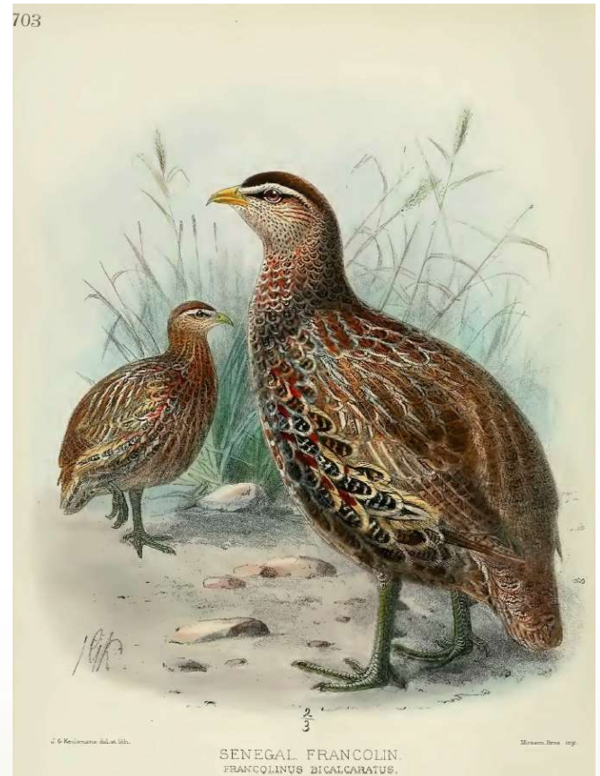
Fig. 3. Lámina que representa al francolín biespolado de Marruecos ( Francolinus bicalcaratus ayesha / Pternistis bicalcaratus ayesha ) en la obra A history of the birds of Europe, including all the species inhabiting the western palaeartic region (Dresser, 1896)

muestra en la lámina del último volumen de la obra A history of the birds of Europe, including all the species inhabiting the western palaeartic region (Dresser, 1896).