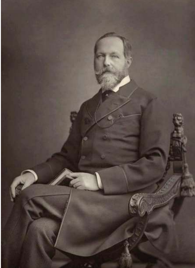
Fig. 5. Retrato de Luís Felipe Alberto de Orleans (1838-1894), conde París, introductor del francolín biespolado de Marruecos en su posesión sevillana de Villamanrique

motivos para que, como se dice en el texto precedente, el francolín biespolado no llegara a reproducirse en tierras sevillanas.