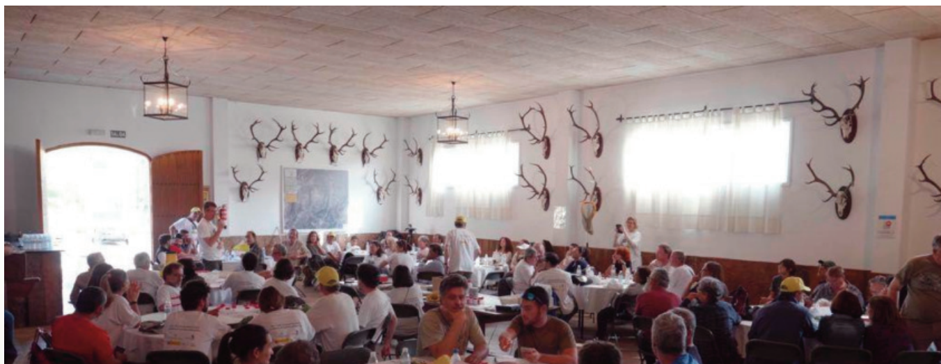
Imagen general de los grupos de trabajo en la fase de análisis de toma de muestras durante el Bioblitz realizado en Montes de Propios de Jerez el 26 de Mayo de 2018.