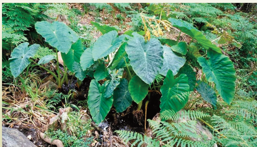
Oreja de elefante ( Colocasia esculenta , F. Araceae) fotografiada en los alrededores del Cortijo de la Jarda durante el Bioblitz realizado en Montes de Propios de Jerez el 26 de Mayo de 2018.

Sedum mucizonia Sedum sediforme Selaginella denticulata Senecio jacobea Senecio lopezii Serapias lingua Serapias parviflora Sibthorpia europaea Silene colorata Silene gallica Silene latifolia Silene nocturna Silene vulgaris Simethis mattiazzi Sisymbrium irio Sisymbrium officinale Smilax aspera Smyrniolum olusatrum Smyrniolum perfoliatum Solanum linneanum Solanum nigrum Sonchus asper Sonchus oleraceus Spergula arvensis Stachys arvensis Stachys germanica Stachys ocymastrum Stauracanthus boivinii Stellaria pallida