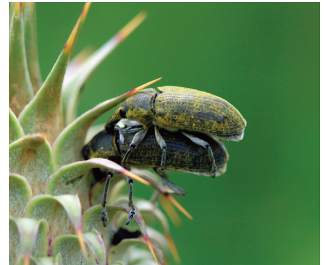
Larinus sp. (Coleoptera: Curculionidae) fotografiado en el sendero Arroyo del Parral durante el Bioblitz realizado en Montes de Propios de Jerez el 26 de Mayo de 2018.

Aiolopus strepens Ameles sp. Anacridium aegyptium Chorthippus apicalis