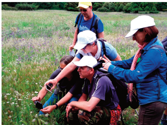
Los componentes del Grupo 8 en la Laguna Seca durante el Bioblitz realizado en Montes de Propios de Jerez el 26 de Mayo de 2018.

tienen un alto valor etnológico por su ubicación, arquitectura o historia además de su valor ecológico. Este proyecto ha favorecido la puesta en valor de este importante recurso y como no, su conocimiento y conservación.