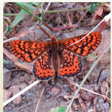
Euphydryas aurina (Lepidoptera: Nymphalidae) fotografiado en el sendero Arroyo del Parral durante el Bioblitz realizado en Montes de Propios de Jerez el 26 de Mayo de 2018.