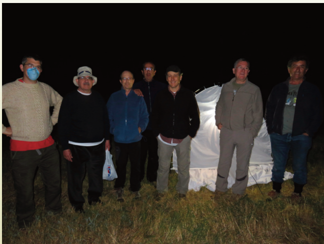
Grupo que participó en el muestreo nocturno de lepidópteros realizado en los alrededores del Cortijo de Rojítán) durante el Bioblitz realizado en Montes de Propios de Jerez el 26 de Mayo de 2018.