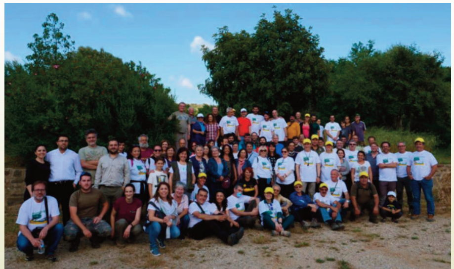
Participantes en el Bioblitz realizado en Montes de Propios de Jerez el 26 de Mayo de 2018.

Phylloscopus bonelli Phylloscopus ibericus Picus sharpei Podarcis vaucheri Psammodromus algirus Psammodromus hispanicus Rattus rattus Regulus ignicapillus Sitta europea Strix aluco Sturnus unicolor Sus scrofa Sylvia atricapilla Sylvia melanocephala Tarentola mauritanica Triturus pygmaeus Troglodytes troglodytes Turdus merula Upupa epops Vulpes vulpes