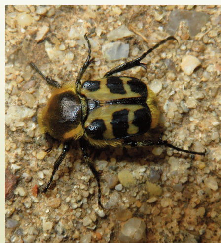
Treichius rosaceus (Coleoptera: Cetoniidae) fotografiado en el sendero Arroyo del Parral durante el Bioblitz realizado en Montes de Propios de Jerez el 26 de Mayo de 2018.

Acmaeoderella discoidea Agapanthia cardui Agapanthia annularis Agapanthia asphodeli Allotarsus Alphasida luctuosa Anisoplia baetica Anthaxia dimidiata Anthaxia sp. Anthrenus sp. Berberomeloe majalis