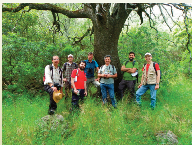
Los componentes del Grupo 1 en Monifarti durante el Bioblitz realizado en Montes de Propios de Jerez el 26 de Mayo de 2018.