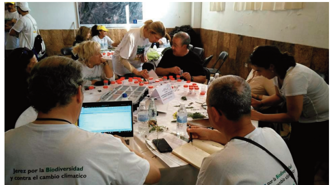
Análisis de las tomas de muestras (en este caso, plantas) recogidas durante el Bioblitz realizado en Montes de Propios de Jerez el 26 de Mayo de 2018.

El Bioblitz se realizó durante 24 h desde las 12:00 del día 26 de mayo finalizando a las 12:00 h del día 27 de mayo de 2018.