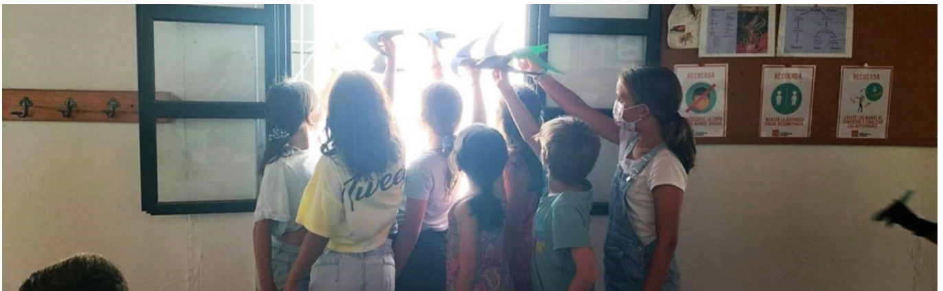
Figura 4. Niños en la ventana con vencejos

Esclavas del Sagrado Corazón de Jesús y precursores del proyecto Vencejos Medianeros de Jerez. El alumnado de este colegio tiene la suerte de verlos volar por el patio todas las mañanas a escasos metros de altura, dando la impresión de que quisieran ser partícipes de sus juegos. Los vencejos ya forman parte de la vida del colegio y han logrado hacerse un hueco en el corazón de toda la comunidad educativa del centro y de su área de influencia. Durante el transcurso del año académico, y enmarcado en el propio currículum, el alumnado tiene la oportunidad de investigar y aprender sobre la interesante vida de estas mágicas aves gracias a las observaciones que puede realizar a través de la Webcam_Vencejo en directo y en colaboración con SEO Birdlife. Muchas son las actividades desarrolladas en relación con el proyecto: taller de identificación de aves, primeros auxilios y alimentación, cría de tenebrios como alimento base en la recuperación de huérfanos, celebración del día de las aves, celebración de la vuelta de los vencejos tras la invernada y celebración del “Día internacional del vencejo”. Igualmente se realizan actividades dentro de la misma programación de las distintas materias curriculares, en especial en las de Ciencias Naturales (seguimiento y recogida de datos durante su anidación), Lengua Castellana (cuentos, poemas, redacciones...) y Artística (dibujos, carteles, canciones...).