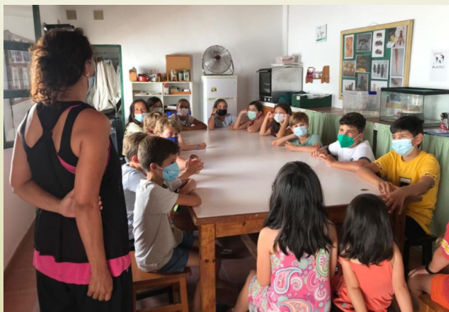
Figura 1. En el aula con la primera parte de explicación