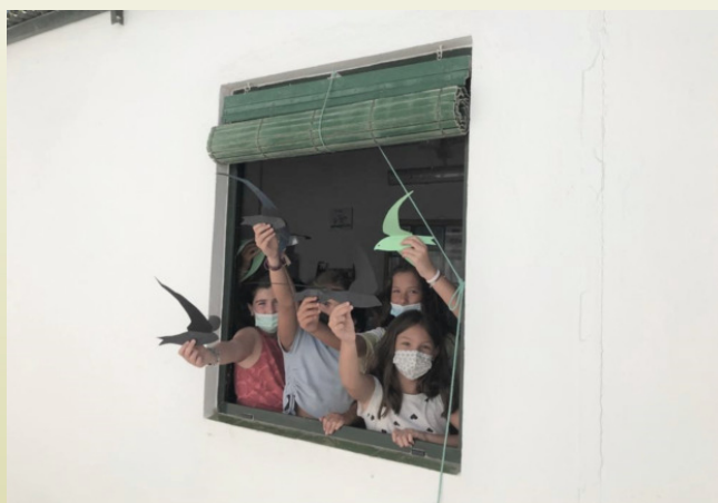
Figura 3. Niños en la ventana con vencejos

En la tercera parte se trasladó a los niños a la sala de proyecciones, donde tuvieron la oportunidad de ver varios vídeos relacionados con los vencejos. Estos vídeos fueron preparados y cedidos amablemente por José Ignacio Quevedo y José Luis Nieto, socios de la SGHN, profesores del colegio