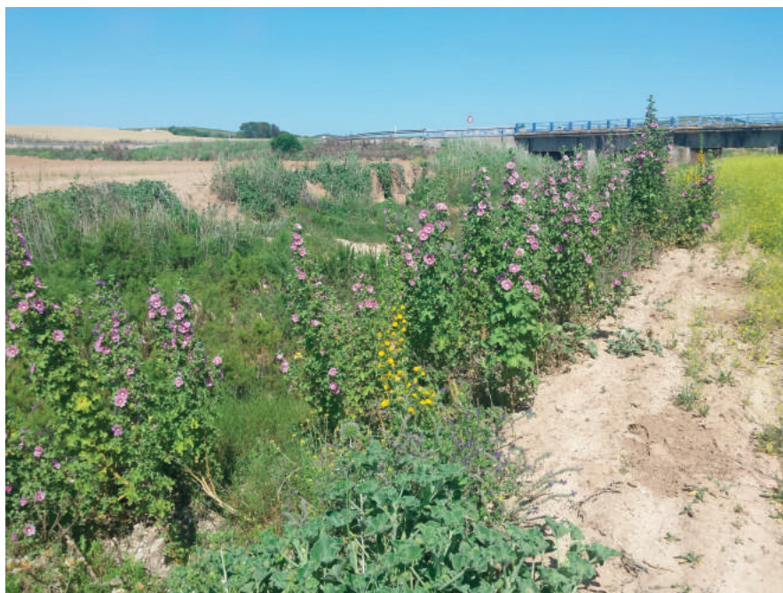
Figura 3. Rodal de Lavatera triloba entre el margen de un arroyo salado y el borde de un terreno de cultivo de secano en la campiña de Sevilla, Lebrija.