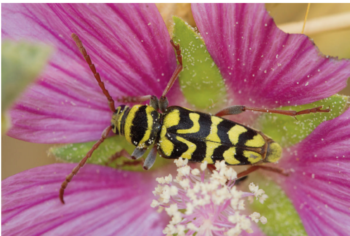
Figura 1. Plagionotus andreui sobre flor de Lavatera triloba en la localidad de Lucena del Puerto, primera cita para la provincia de Huelva.

La distribución actual de L. triloba el reflejo de la fragmentación del paisaje ocurrida durante siglos por la intensificación de la agricultura. En la actualidad las escasas localidades de presencia se encuentran restringidas a suelos gipsícolas o salinos, en bordes y taludes de caminos y carreteras o de cursos de agua o lagunas. Todos estos lugares son extremadamente vulnerables.