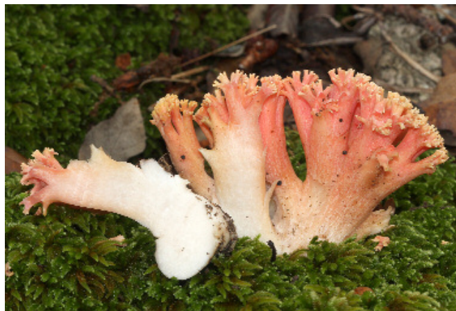
Fig. 1. Ramaria subbotrytis.

Becerra Parra M, Robles Domínguez E. 2009. Las setas de la provincia de Cádiz. 100 especies para conocer su riqueza micológica. Editorial La Serranía. Ronda.