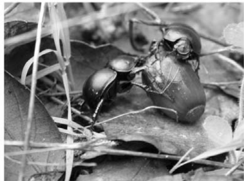
Figura 2. Fotografía detalle de coleópteros ( Thorectes laevigatus cobosi ) depredando