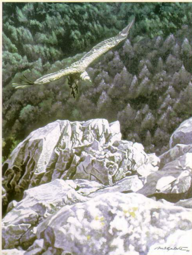
Detalle "Ale Delta" ( Buitre Leonado ) Óleo sobre tabla, Manuel D. Galote